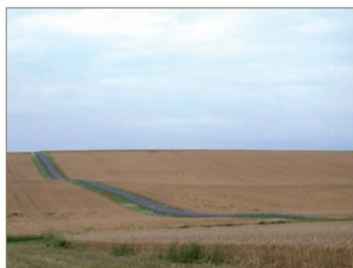
Bande enherbée, EARL Arc en Ciel