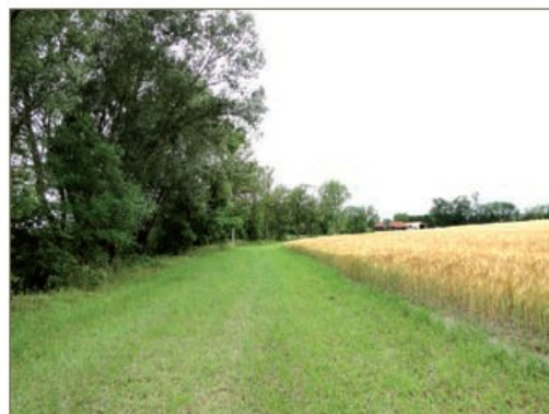
Bande tampon, EARL Outrivière

L'agro-écologie participe à la qualité et à la diversité des paysages, à l'identité culturelle du territoire et offre des zones propices aux activités de promenades, de randonnées, de cueillette, de pêche et de chasse... Les IAE participent à la qualité de la vie rurale.